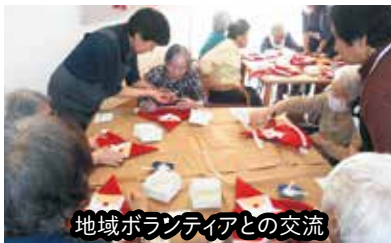
地域ボランティアとの交流