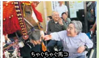
ちゃぐちゃぐ馬こ